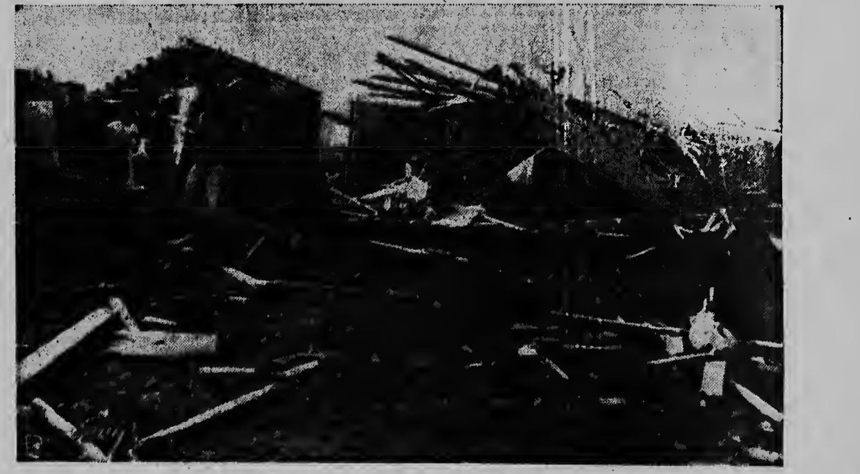
Victimanan di un tornado ta busca nan cosnan cu por a sobra na Tinley Park, Illinois, un 15 milja zuid di Chicago, caminda nuebe cas a keda destrui y cuater persona herida ultimamente.